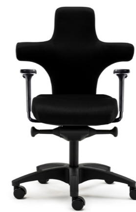
1 Small mit BS-Sitz [95] und Poly-Fußkreuz [44]