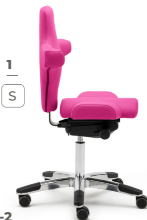
1-2 PICASSO YOUNGSTAR mit Synchron-Mechanik

Größe S: Niedrige Sitzhöhe 47-57 cm (FK 44) bzw. 46-56 cm (FK 53)