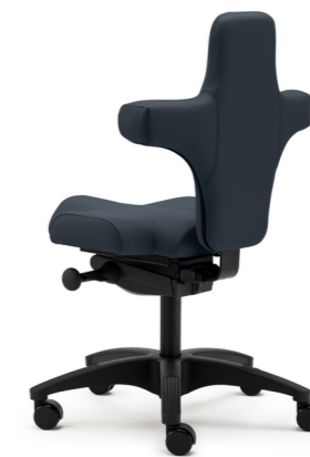
1 Small Stoffgruppe 5, Echtleider 624 Azzurro