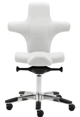
2 Small Stoffgruppe 5, Echtleider 601 Bianco Ottico