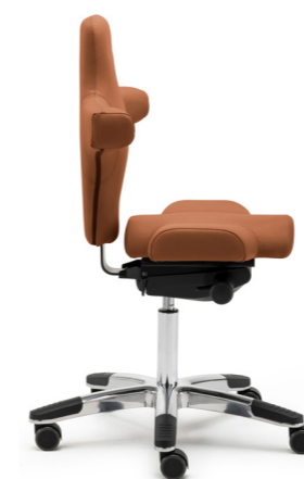
2 Small mit Sattel-Sitz [89] und Alu-Fußkreuz [53]

Abb. mit Sattel-Sitz [89], ohne Armlehnen, Stoffgruppe 5, 700 Fuxia, mit Alu-Fußkreuz [53]